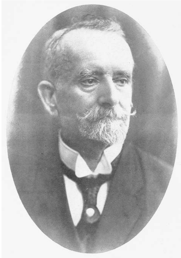
Fig. 2 - Ritratto fotografico di Fridiano Cavara (MONTEMARTINI, 1929).

96; 1892; 1894; BRESADOLA e CAVARA, 1901; CAVARA e BRESADOLA, 1900) e descrizioni di nuove specie (CAVARA, 1902b).